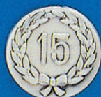
X-413 15 i. Kranz