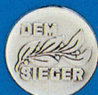
X-415 Dem Sieger