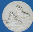
X-483 Inline Skater