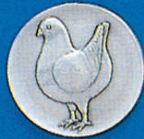
X-351 engl. Modena