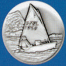
X-425 Segelboot Optimist