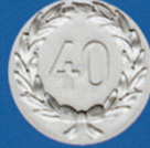
X-464 40 I. Kranz