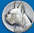
X-355 Boxerhunde kopf neu