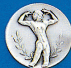
X-345 Body-Frau neu