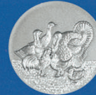
X-492 Geflügel u. Wassergeflügel