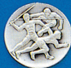
X-342 Leichtathl. Dreikampf