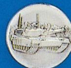
X-403 Abrams (Panzer)