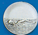
X-337 Schwimmerin Crow