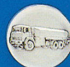
X-416 Straßentank w.