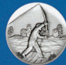
X-428 Angler neu