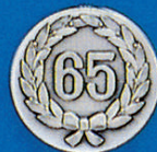
X-390 65 i. Kranz