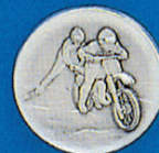
X-399 Ski Jöring