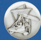
X-481 ULM Ultralight