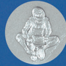
X-498 Mini Bike