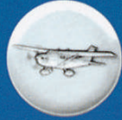
X-429 Cessna (Flugzeug)