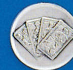
X-382 Schafkopf (Sp.)