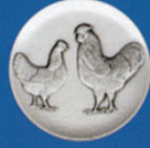
X-436 Barnevelder Hühner