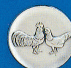
X-419 Ital. Huhn