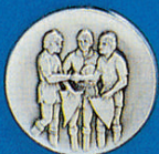
X-410 Wimpelüb. Fußb.