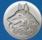
X-421 Belg. Schäferhund