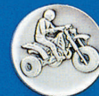
X-348 Tribike (Dreirad)