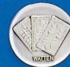
X-381 Watten (Sp.)