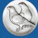
X-453 Dragon Taube