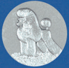
X-496 Pudel NEU