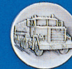
X-369 M915 LKW