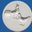
X-458 Hamburger Hühner