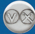
X-432 Volks- u. Raiffeisenb.