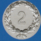
X-474 Kranz „2“