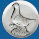
X-426 Altholl. Tümmler