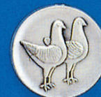
X-395 Modeneser Taub.