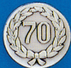
X-391 70 i. Kranz