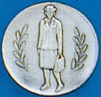
X-350 Lady Soldier