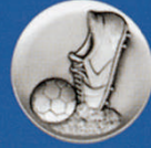
X-472 Fußball Schuh - neutral