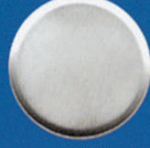
X-444 gewölbt u. glatt