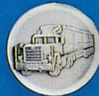
X-387 45 LKW