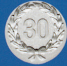
X-463 30 I. Kranz