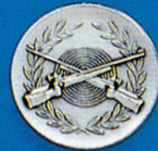
X-352 Gebr. Gewehre