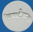
X-488 Seifenkiste NEU