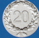
X-465 20 I. Kranz