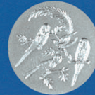
X-491 4 Vögel