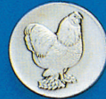
X-349 Brahma Huhn