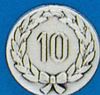
X-412 10 i. Kranz