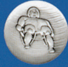
X-476 Rennrodler neu