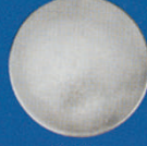
X-443 Flach u. glatt