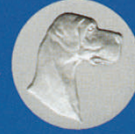
X-479 Deutsche Dogge neu