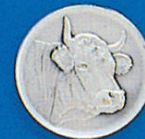
X-377 Dt. Fleckvieh