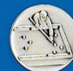
X-406 Loch Billard