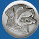
X-478 Rottweilerkopf neu