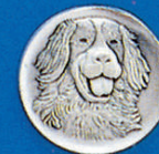
X-380 Bern. Sennenh.