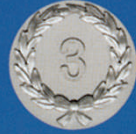
X-475 Kranz „3“