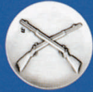
X-459 gekr. Gewehre