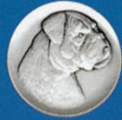
X-427 Boxerhund neu