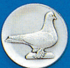
X-338 Lahore Taube