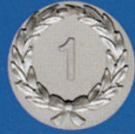
X-473 Kranz „1“