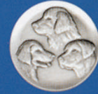
X-457 3 Hundeköpfe