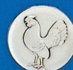
X-417 Sebr. Huhn